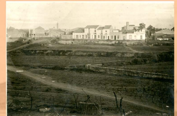
Barri de Ca n'Aurell, 1920. Autor desconegut. Arxiu Municipal de Terrassa. Reg. 29448.