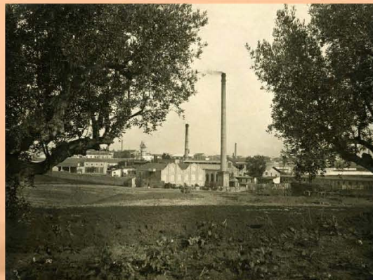
Fàbrica de Ca l'Estruch. Autor: Francesc Casañas i Riera, anys 20. Arxiu privat Roser Trallero. Col·lecció Les Veus del Tèxtil, FBiC.