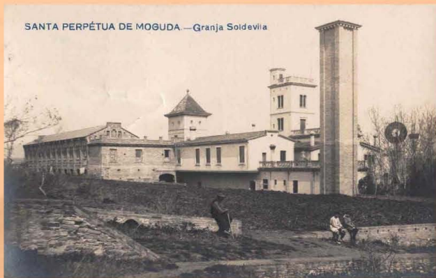
Postal de la Granja Soldevila. Anys 30.